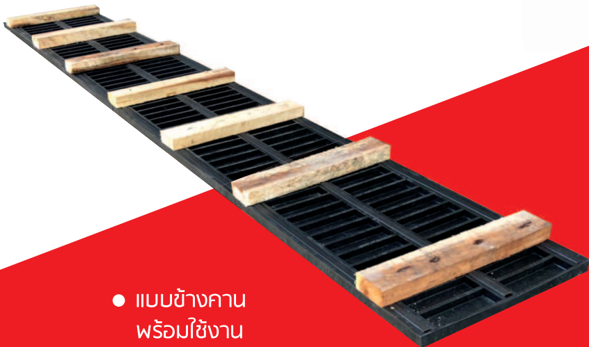
● แบบข้างคาน พร้อมใช้งาน