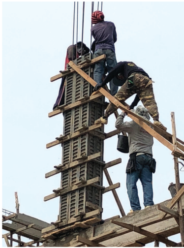
● แบบเสา พร้อมใช้งาน